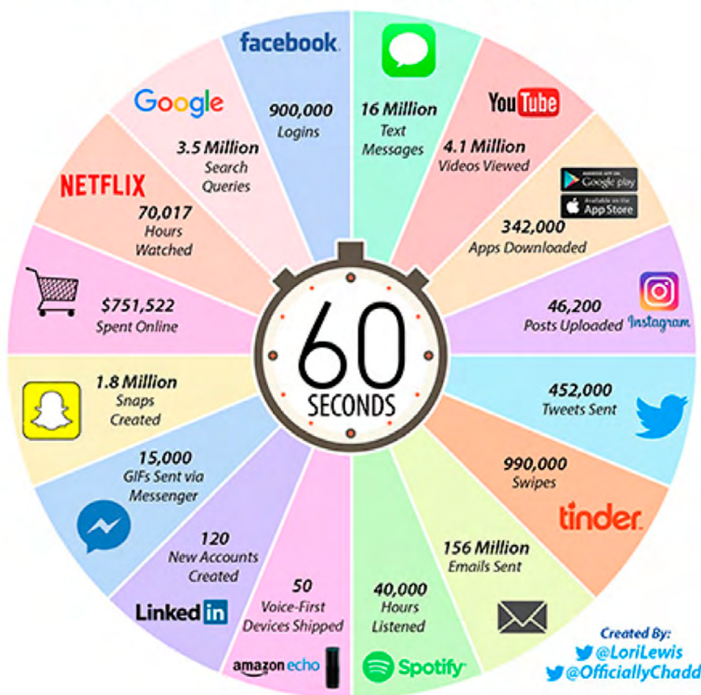
Ilustracja 1: Co dzieje się w internecie przez 60 sekund ( http://thebln.com/2017/03/happens-every-minute-internet-2017/ )